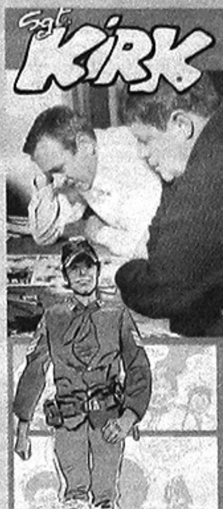
La locandina della mostra

Al Baratta dal 5 al 30 Il Sergente Kirk in mostra