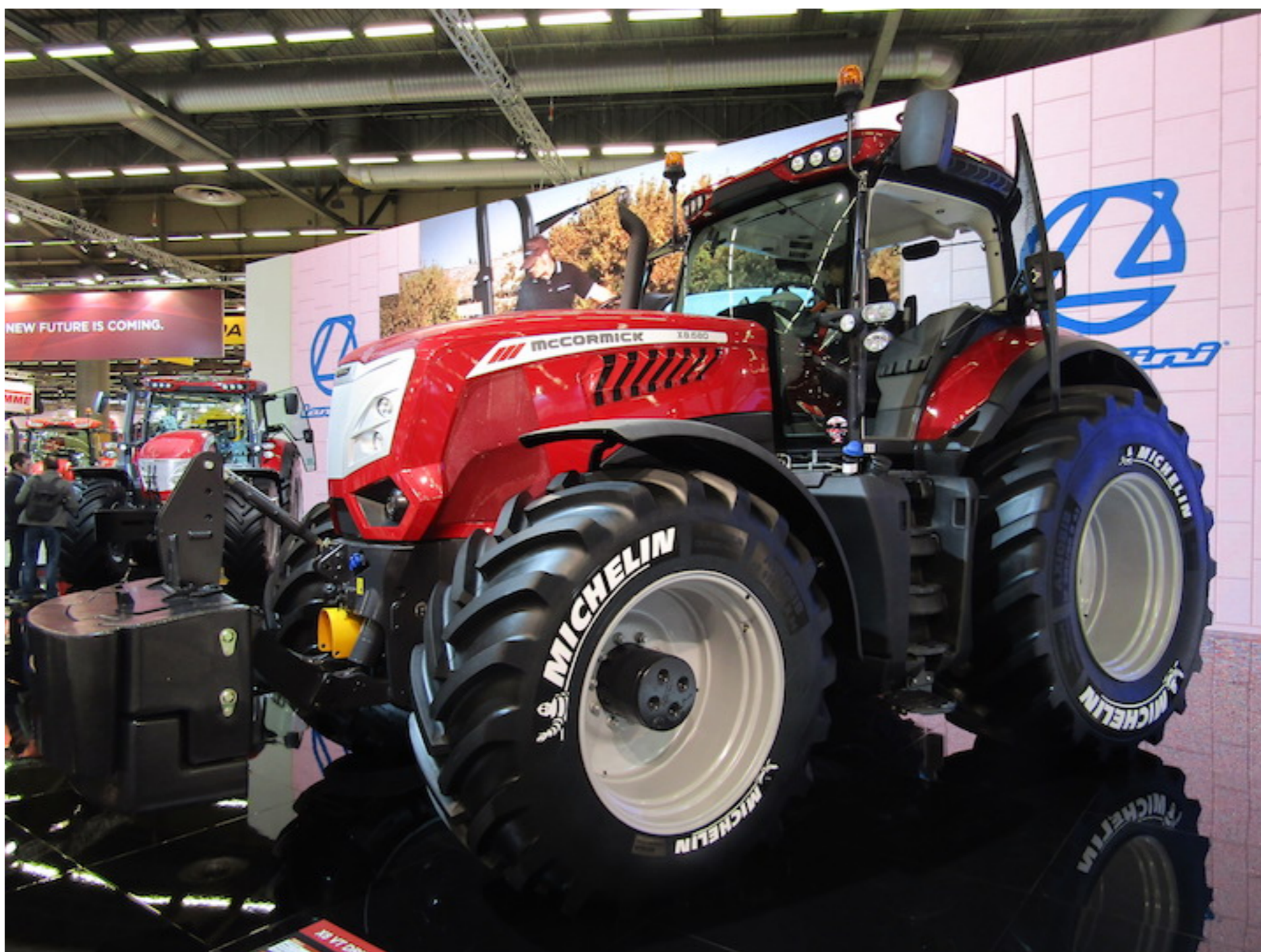
Il modello X8.680 è stato uno dei protagonisti dello show del brand di Argo Tractors

Le tre macchine, caratterizzate da prestazioni eccezionali, contenuti tecnologici all'avanguardia e look aggressivo, sono allestite con motori a 6 cilindri Betapower Fuel Efficiency Tier4 Final e sono dotate di una trasmissione a variazione continua a 4 stadi con velocità di 40 chilometri orari in regime Eco a 1.300 giri al minuto e di 50 chilometri orari Eco a 1.600 giri al minuto .