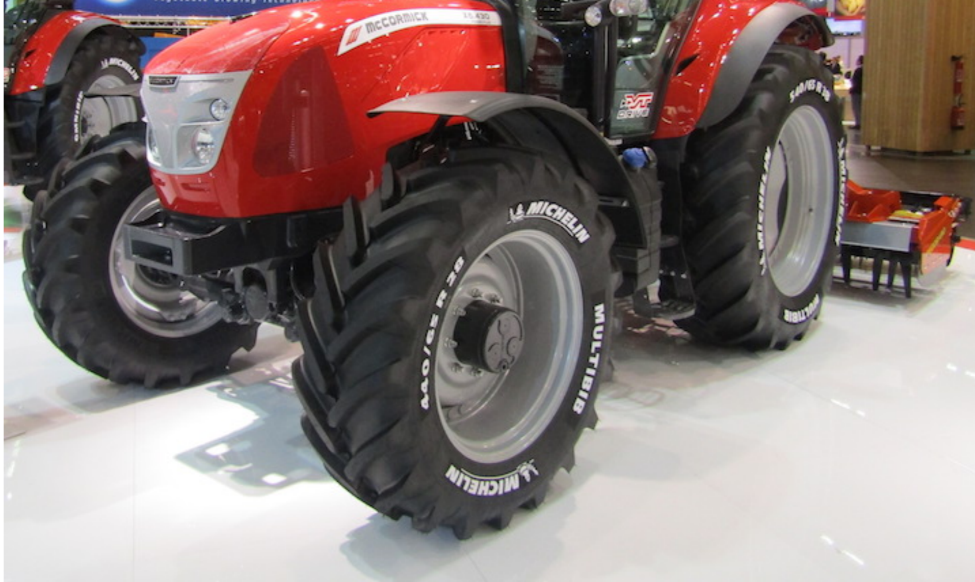
Trattore X6.420 esposto presso lo stand McCormick

La cabina è stata realizzata secondo gli standard più elevati in termini di comfort , silenziosità e visibilità , in linea con i prodotti della fascia di gamma più alta. Proprio per questo motivo, il comfort durante le operazioni in campo e di trasporto è garantito dalla sospensione della cabina e da un assale anteriore dotato di sospensione a bracci indipendenti, disponibili in opzione.