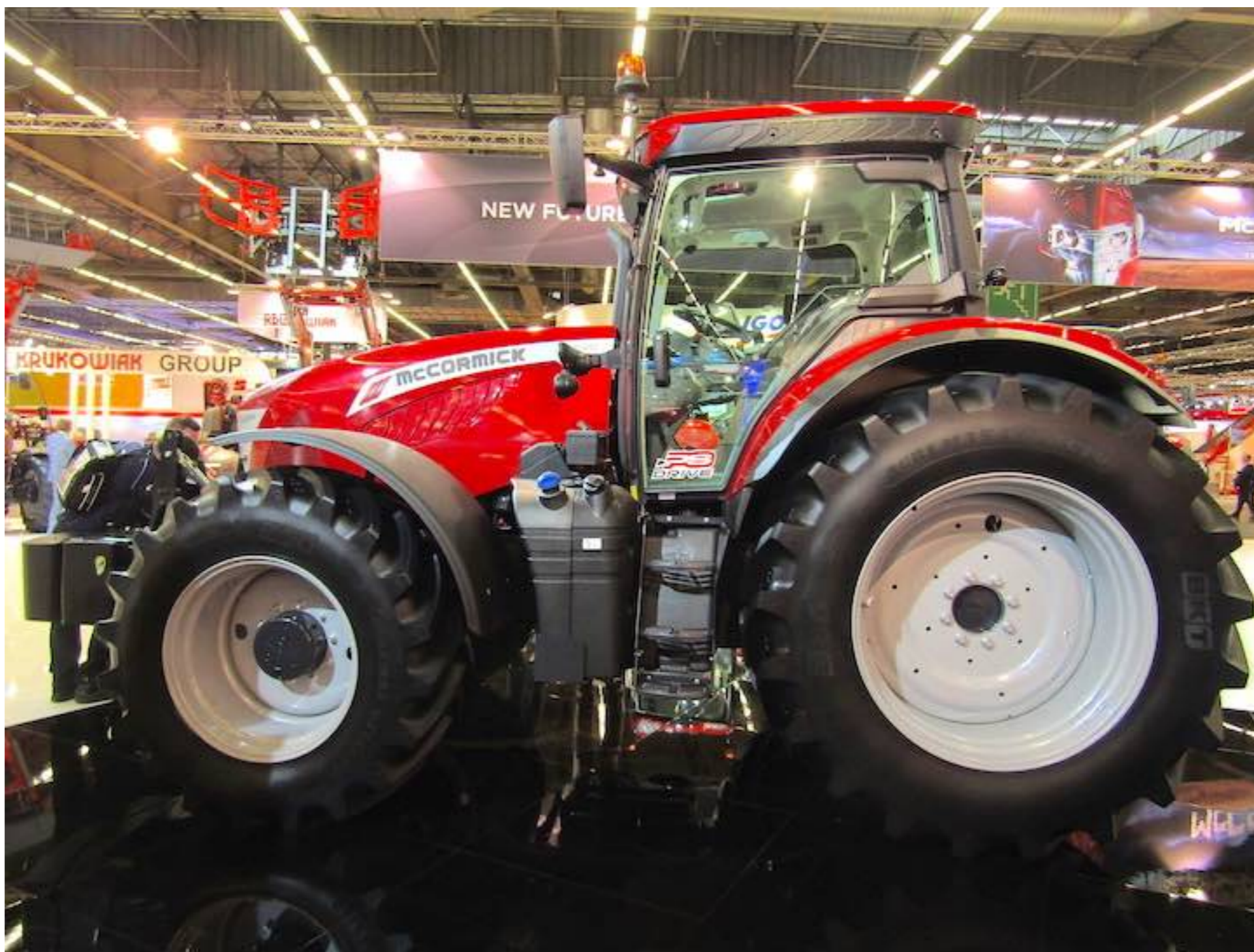
Nuovo McCormick X7.690 presente al Sima 2017

L'altra novità riguarda la trasmissione che su questa linea è ora disponibile sia nella versione VT-Drive (trasmissione a variazione continua fino al modello da 195 cavalli ) che nella versione PS-Drive (trasmissione Powershift che può essere montata su tutti e cinque i modelli ). Attraverso il sistema Stop & Action , si innesta il de-clutch tramite la semplice pressione del pedale del freno, permettendo così alla trasmissione PS-Drive di ottenere una morbidezza di guida molto simile a quella di una trasmissione VT-Drive.