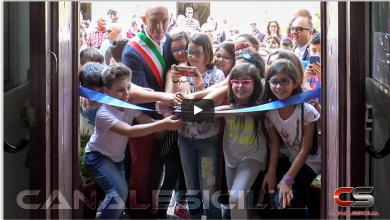
Servizio di Cristina Miragliotta del 28 maggio 2016

consortile costituita su base comprensoriale provinciale dai comuni di Gioiosa Marea, Oliveri, Falcone, Furnari, Terme Vigliatore, Barcellona Pozzo di Gotto e Milazzo.